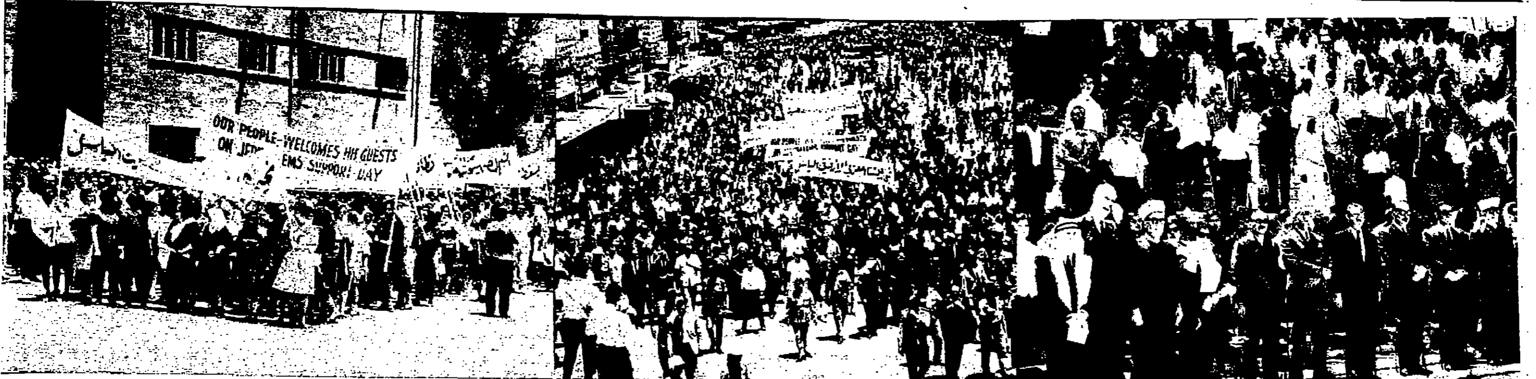
بعض الآلاف الذين حضروا مهرجان عمان